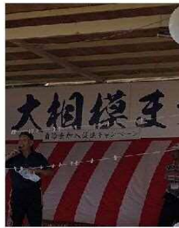
・横断幕設置風景(拡大)