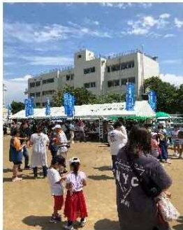
・のぼり旗設置風景①