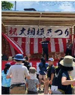
・横断幕設置風景