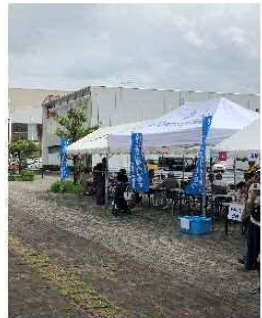
・のぼり旗設置風景