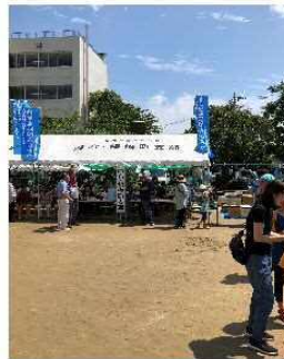
・のぼり旗設置風景②